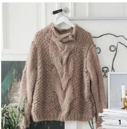
1. Se genseren strikket i camel: CP-011A