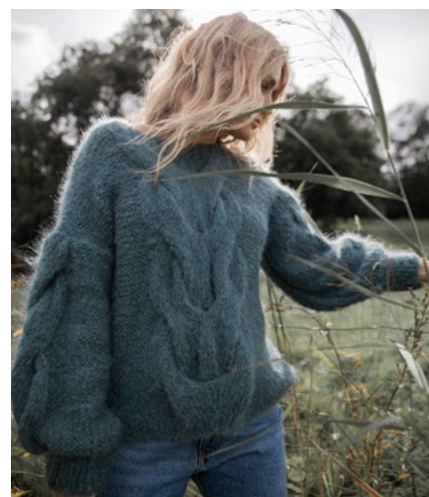
SE OGSÅ CP06-01 CAMELIA FNUGG Agatgrønn 924