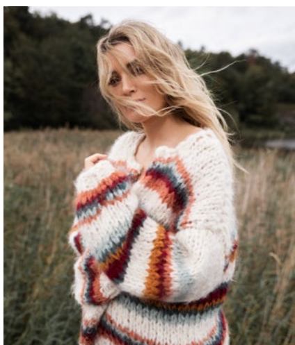
SE OGSÅ CP05-01 WILDFLOWER FNUGG Natur 903, Aprikos 911, Rubinrød 923, Agatgrønn 924, Jadegrønn 913, Ravgul 922

På camillapihlstrikk.no finner du alle de fantastiske fargene i garnene PIHLROS, FNUGG og OLAVA. Bla i fargekartet og finn dine favoritter. Finner du ikke garnet og fargene i din nærbutikk? Nå kan du bestille alle garntypene direkte i vår nettbutikk: www.hoy.no