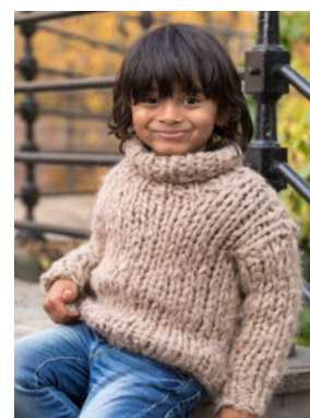
Se også CP11-05 ANNE KIDS PIHLROS Kamel 905 FNUGG Kamel 905