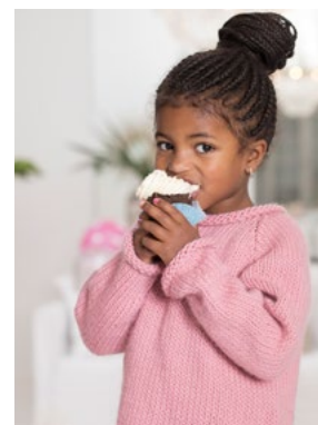
Se også CP13-05 CYCLAMEN KIDS OLAVA Myk korall 910