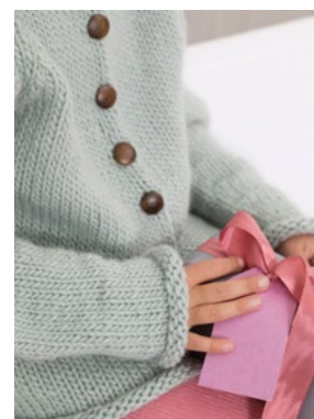
Se også CP13-02 FORMOSA KIDS OLAVA Jadegrønn 913