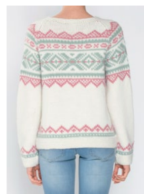
Se også CP-30 IRIS OLAVA Hvit 902, Jadegrønn 913, Myk korall 910