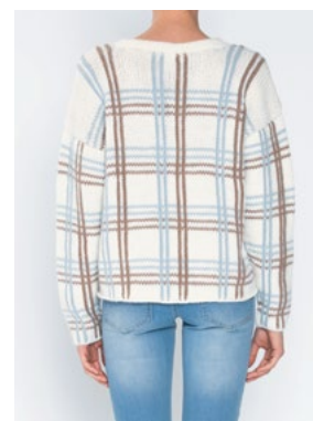
OLAVA Hvit 902, Kamel 905, Himmelblå 904