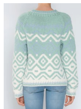
Se også CP-41 BLUEBELL OLAVA Jadegrønn 913, Hvit 902, Himmelblå 904