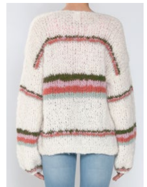
Se også CP-39 DANDELION

FNUGG Hvit 902, Oliven 906, Perlerosa 909, Aprikos 911, Perlemint 912