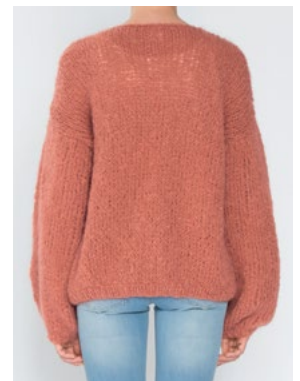
FNUGG Aprikos 911