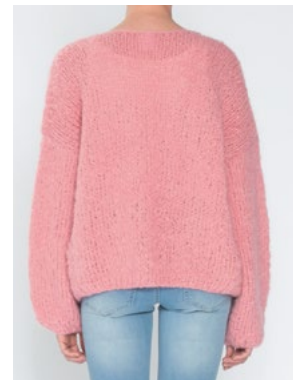
FNUGG Myk korall 910