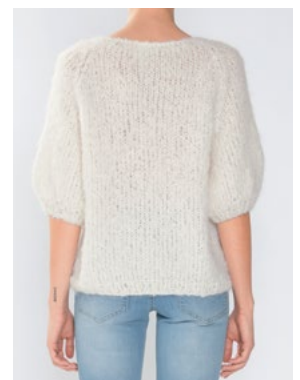
Se også CP-43 PEONY FNUGG Hvit 902