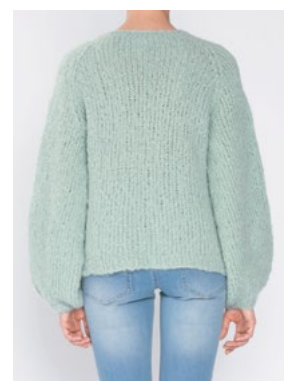
FNUGG Jadegrønn 913