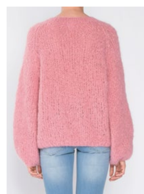
FNUGG Myk korall 910