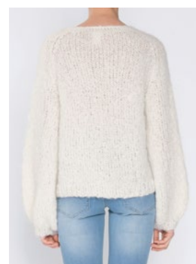
FNUGG Hvit 902