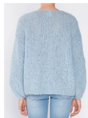
FNUGG Himmelblå 904