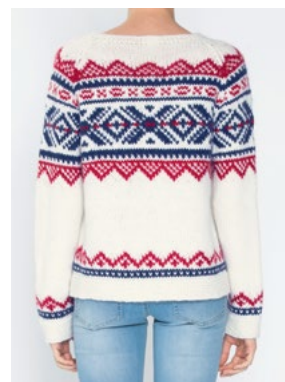
Se også CP-49 IRIS OLAVA Hvit 902, Rød 907, Marine 908