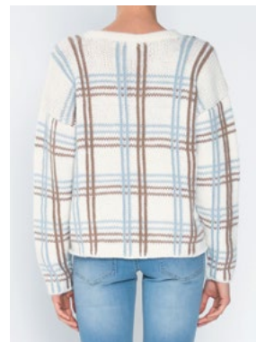
OLAVA Hvit 902, Kamel 905, Himmelblå 904