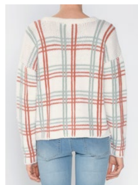
Se også CP-32 BUTTERCUP OLAVA Hvit 902, Aprikos 911, Perlemint 912