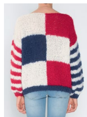
Se også CP-52 PANSY FNUGG Hvit 902, Rød 907, Marine 908