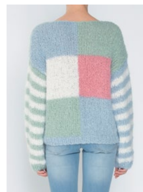
FNUGG Hvit 902, Jadegrønn 913, Myk korall 910, Himmelblå 904