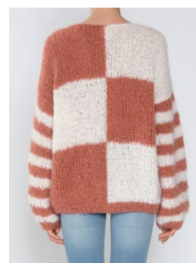
Se også CP-35 PANSY FNUGG Aprikos 911, Hvit 902