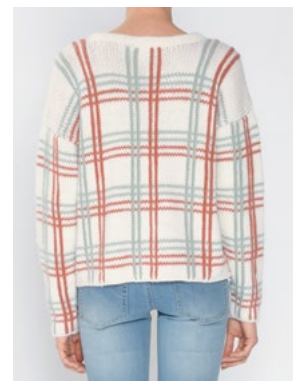
Se også CP-32 BUTTERCUP OLAVA Hvit 902, Aprikos 911, Perlemint 912