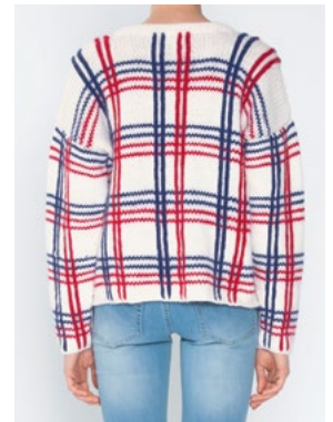
Se også CP-51 BUTTERCUP OLAVA Hvit 902, Rød 907, Marine 908