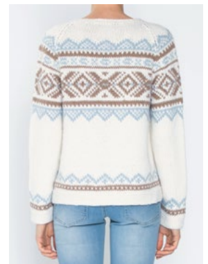
Se også CP-57 IRIS OLAVA Hvit 902, Himmelblå 904, Kamel 905