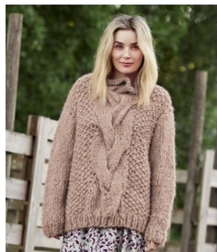
SE OGSÅ CP-11A HENRIETTE OLAVA Kamel 905, FNUGG Kamel 905