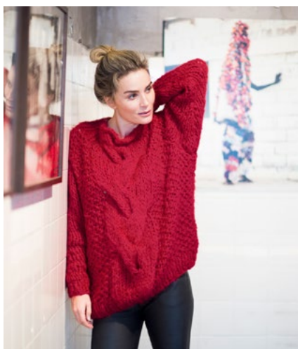
SE OGSÅ CP-25A HENRIETTE OLAVA Rød 907, FNUGG Rød 907

På camillapihlstrikk.no finner du alle de fantastiske fargene i garnene PIHLROS, FNUGG og OLAVA. Bla i fargekartet og finn dine favoritter. Finner du ikke garnet og fargene i din nærbutikk? Nå kan du bestille alle garntypene direkte i vår nettbutikk: www.hoy.no